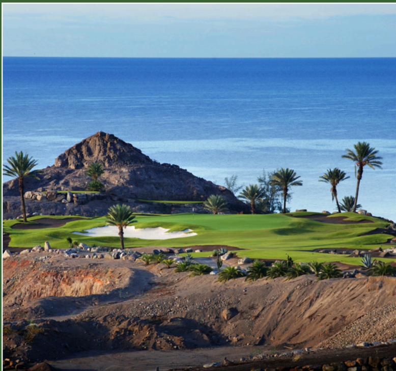
Lopesan Costa Meloneras, Resort & Spa 5* Gran Canaria, Spagna 1 - 8 Gennaio