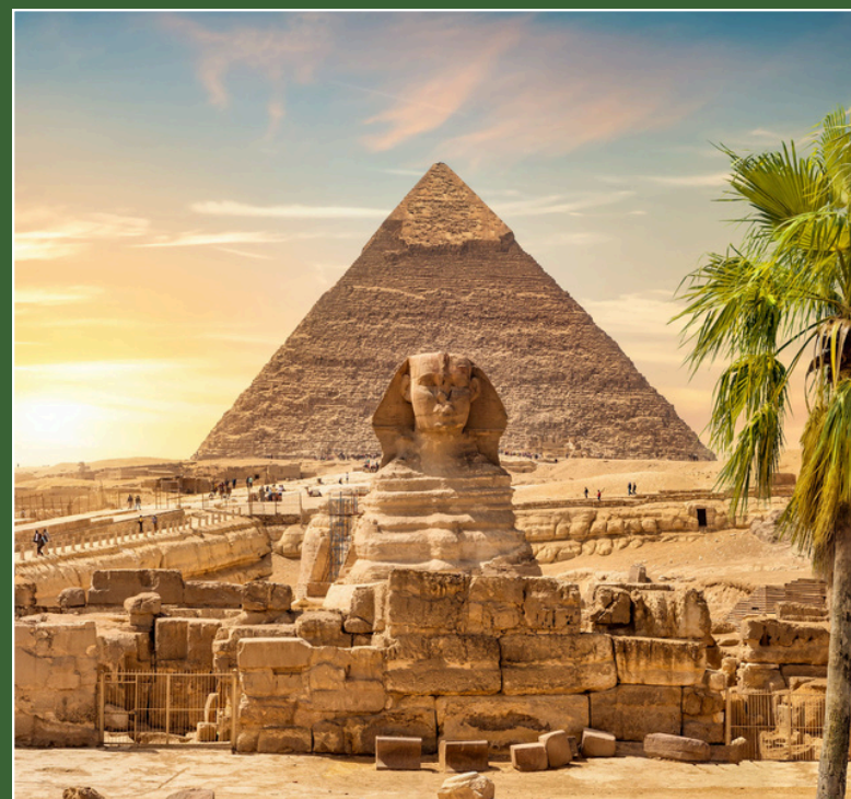
Giza Palace Hotel & Spa 5* Cairo, Egitto 1 - 6 Aprile