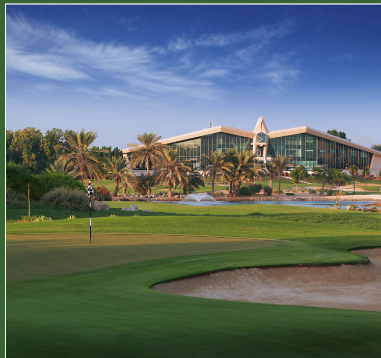
Abu Dhabi Golf Resort & Spa 5* Abu Dhabi, UAE 14 - 19 Febbraio