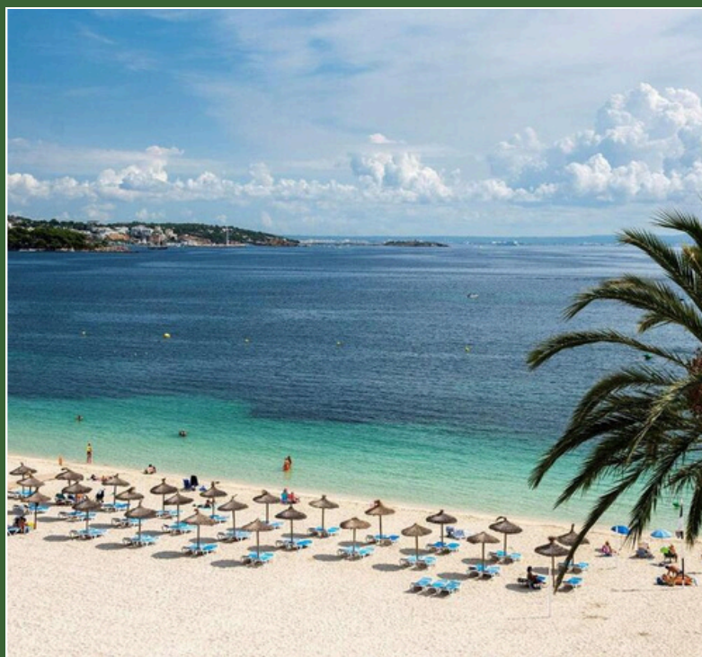
Zel Mallorca 4* Palma di Maiorca, Spagna Aprile