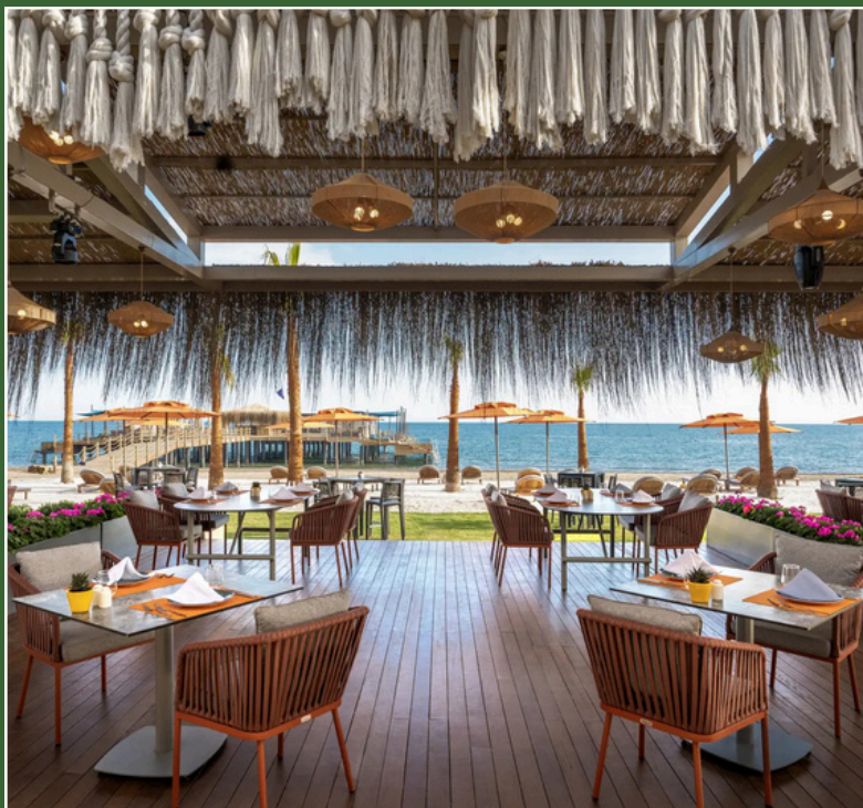
Kaya Palazzo Golf Resort 5* Belek, Turchia 27 - 31 Marzo *inclusa gara AT 4 BALLS