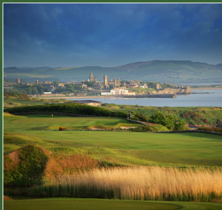
Fairmont St. Andrews 5* St Andrews, Scozia 21 - 24 Luglio