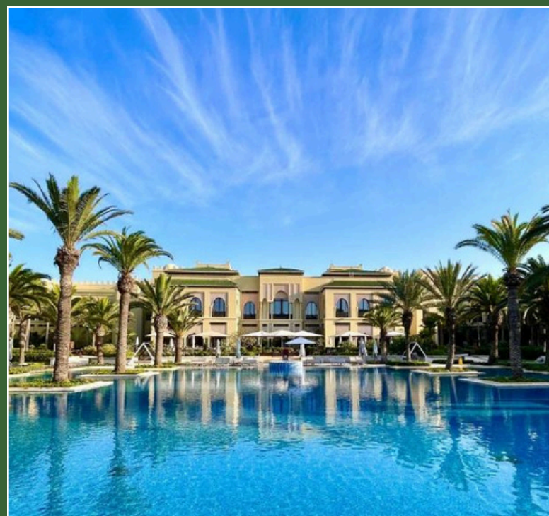
Mazagan Beach & Golf Resort 5* El Jadida, Marocco 4 - 8 Marzo