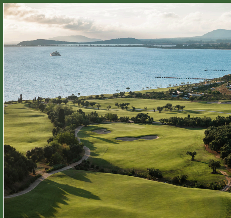
The Romanos 5* Costa Navarino, Grecia 22 - 27 Settembre *inclusa gara AT 4 BALLS