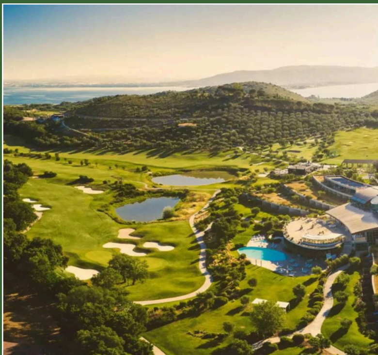
Argentario Golf & Wellness Resort 5* Argentario 12 - 14 Giugno