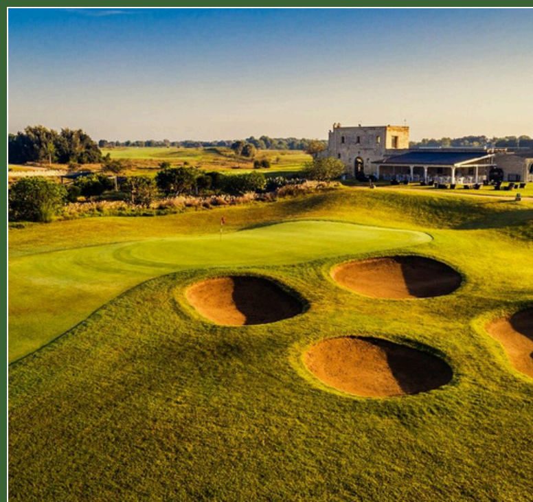
Acaya Golf Resort & SPA 4* Lecce 30 Aprile - 3 Maggio