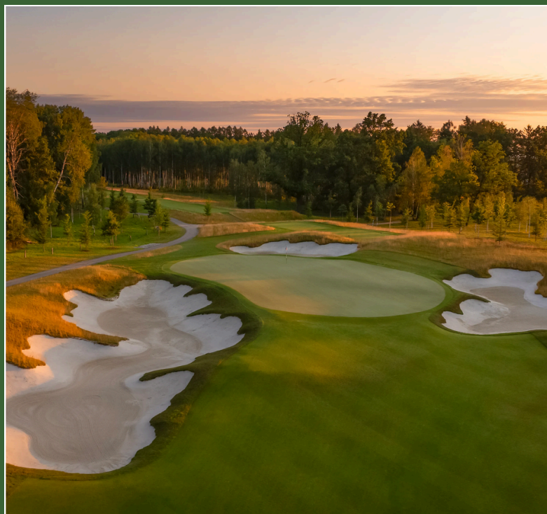
Prague Marriott Hotel 5* Praga, Cechia 28 - 31 luglio *inclusa gara AT 4 BALLS